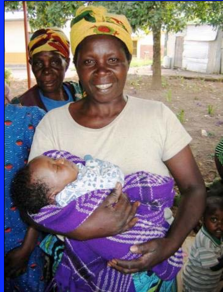
Une cliente souffrant de fistule : L'Hôpital Ruhengeri, Rwanda