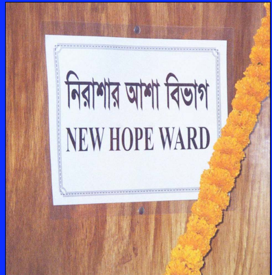
Centre de Fistule, l' hôpital mémorial chrétien de Malumghat, Bangladesh