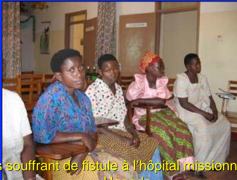
Les clientes souffrant de fistule à l'hôpital missionnaire de Kitovu, Uganda