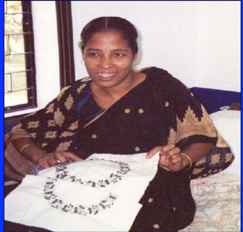
Apprentissage des activités génératrices de revenus L' Hôpital Chrétien Memorial, Bangladesh